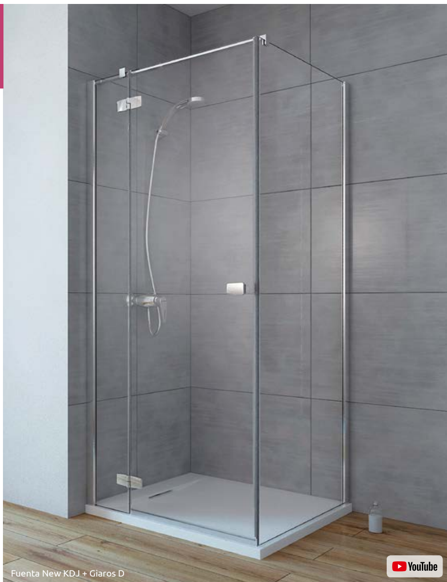
Fuenta New KDJ + Giaros D