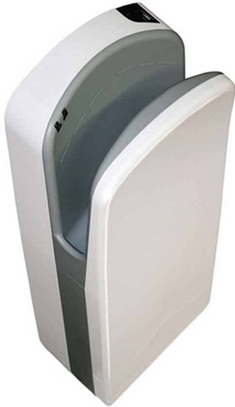
The picture belongs to NOFER 01305.W.TRI-BLADE